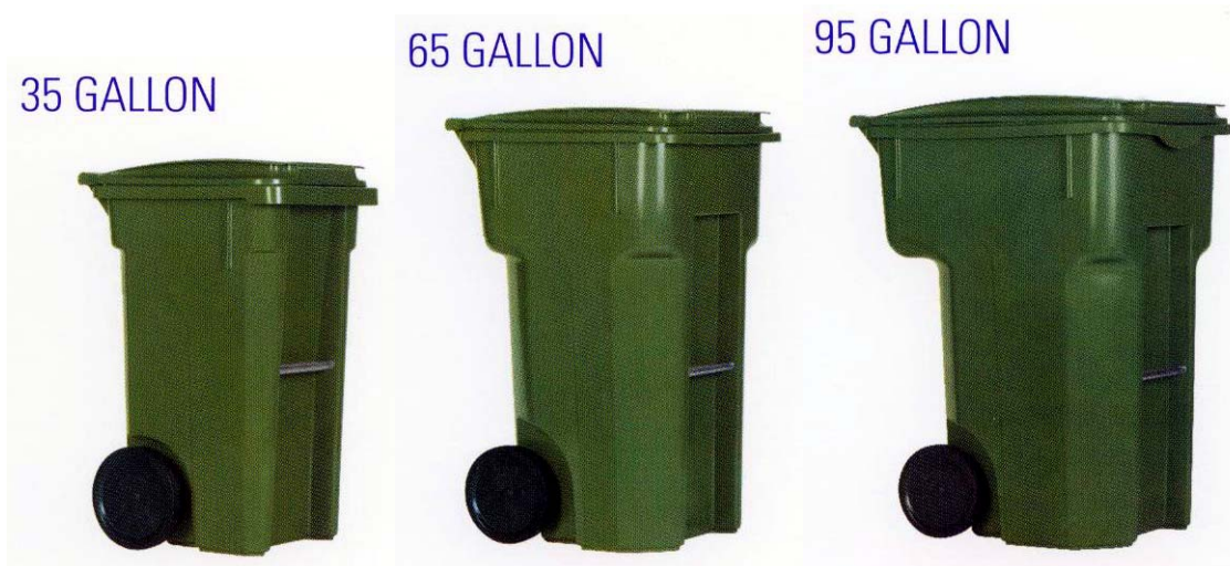
Contenedores Portatiles de Basura, Uso Residenciales