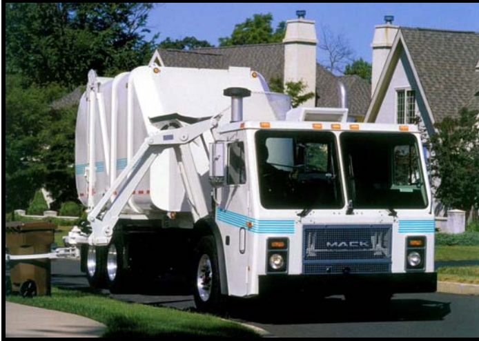
Camións Residenciales Automatizados, con capacidad de carga lateral