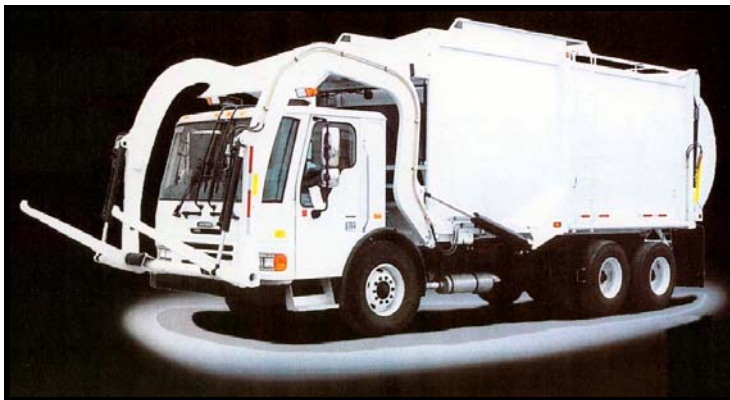
Camiones Comerciales Automatizados, con capacidad de carga frontal